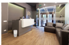
待合室への設置イメージ

全周囲から吸い込むターボファンです。清浄空気をサークルエアで部屋の隅々まで届けます。螺旋状の気流は効率よく空気を循環させ脱臭なら10分で30量のエリアを完了させます。