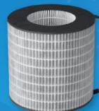
活性炭フィルター